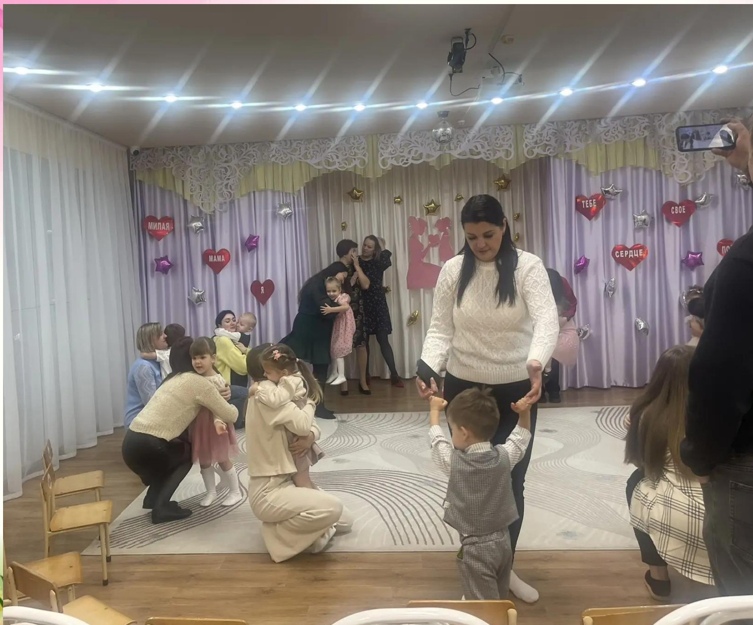
Танцевали с мамами